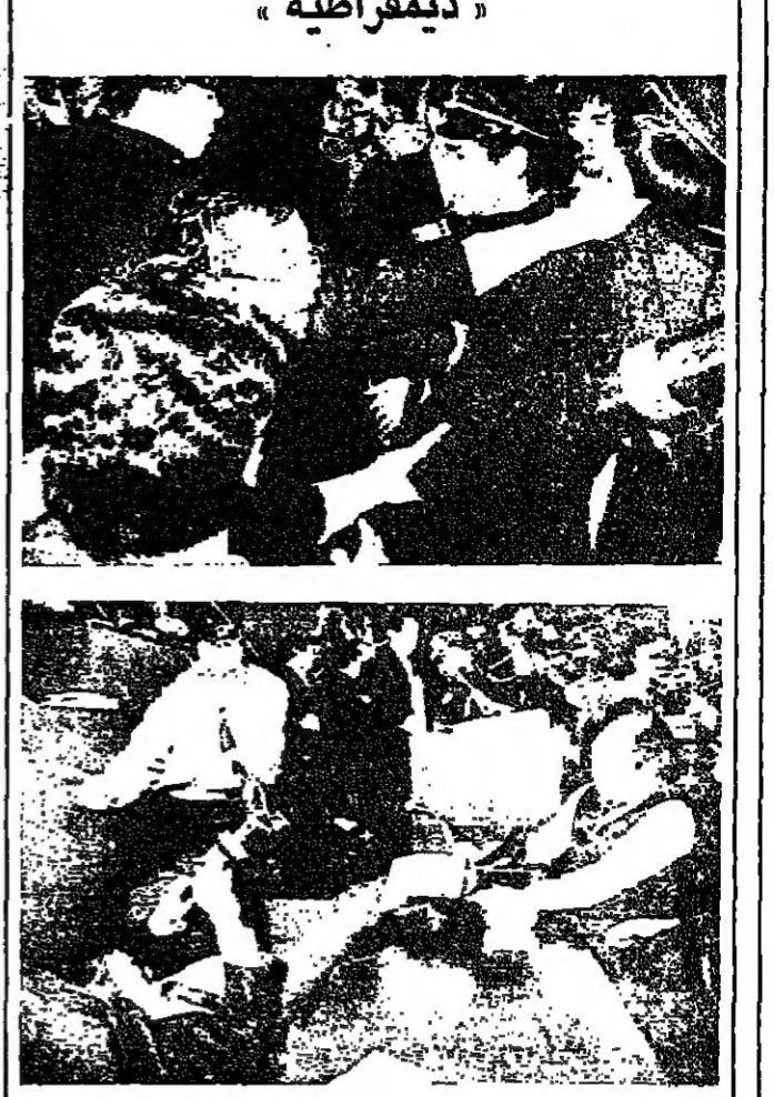
المكان: العاصمة التايوانية (تايبيه) الزمن: كانون الثاني ١٩٨٩ المناسبة: مناقشة برلمانية ... وبقية التفاصيل في الصورين اعلاه.